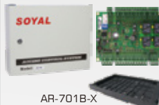
雙門唯根控制器/ 唯根轉RS485轉換器 AR-716-E02